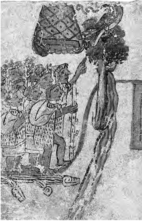
Figura 2. Ma tihuian , “vámonos”. Códice Mexicanus , lámina XVIII.

lección, espacio-tiempo que constituiría asimismo el asentamiento definitivo del pueblo mexicano. El paraje y el momento serían señalados hierofánicamente mediante la blancura del entorno lacustre, un tunal selénico tenochtli y un águila solar cuauhtli , antes de que Tláloc revelara a Axolotl que compartiría el dominio del espacio-tiempo así revelado con el foráneo Huitzilopochtli.