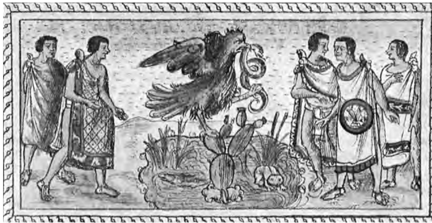
Figura 1. La imagen fundacional de México-Tenochtitlān.

La representación emblemática de la fundación de México-Tenochtitlān (figura 1): el águila posada sobre un tunal rodeado de agua, con una serpiente en el pico del rapaz y asida por una de sus garras, 5 es una imagen epifórica, 6 una especie de mandala 7 que sintetiza ideas y sentimientos, suscita la meditación y se sitúa fuera del tiempo. Esta sín-