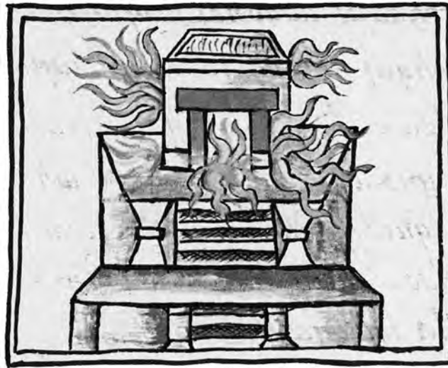
Figura 3. Presagios de una catástrofe. Códice Florentino , libro VIII, f. 11v.

ción de los templos en el momento en que se estrenaban 17 permite establecer una relación (aunque ésta haya sido retrospectiva) entre las fechas 1-acatl y 2-tecpatl (1363/1364) mencionadas en el Códice Mexicanus y la destrucción del Templo Mayor en las mismas fechas, 156 años ( 52 \times 3 ) después (figura 4). La sistematicidad simbólica de los periodos de 52 años en la cronología náhuatl permite deducir fechas, históricas o mitológicas, de acontecimientos considerados como relevantes.