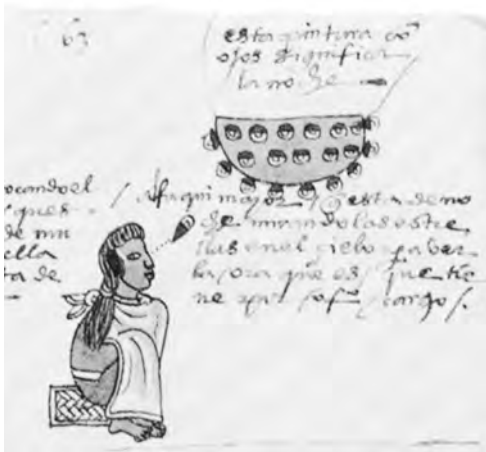
Figura 8. El astrónomo. Códice Mendocino , lámina 63r.

que los fenómenos naturales simbólicamente interiorizados fueran observados y objetivamente referidos. El movimiento de los astros en la bóveda celeste (figura 8) tenía en este contexto un valor espacio-temporal determinante por lo que se registraba en calendarios