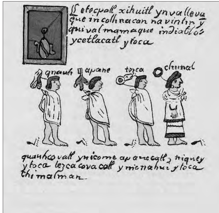
Figura 5. Texto manuscrito correspondiente a la lectura de un códice. Códice Aubin, f. 4r.